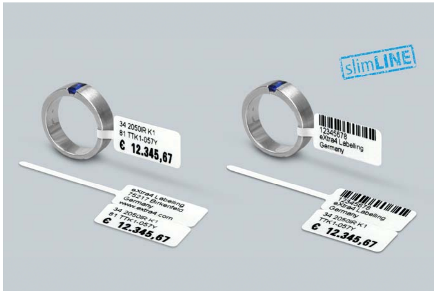
Abb.3: Druckbild des „slimLINE“-Druckers Godex RT200 mit 200 dpi auf „slimLINE“-Schmucketiketten mit Schlaufe, Typ 34 2050IR K1