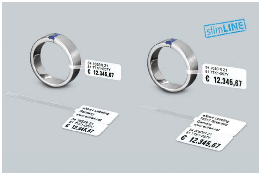
Abb.5: „slimLINE“-Schmucketiketten mit transparenter Schlaufe in den Größen, Small Ref-Nr. 34 1653R Z1 und Standard Ref-Nr. 34 2050IR Z1, Druckbild des „slimLINE“-Druckers Godex RT230 mit 300 dpi.