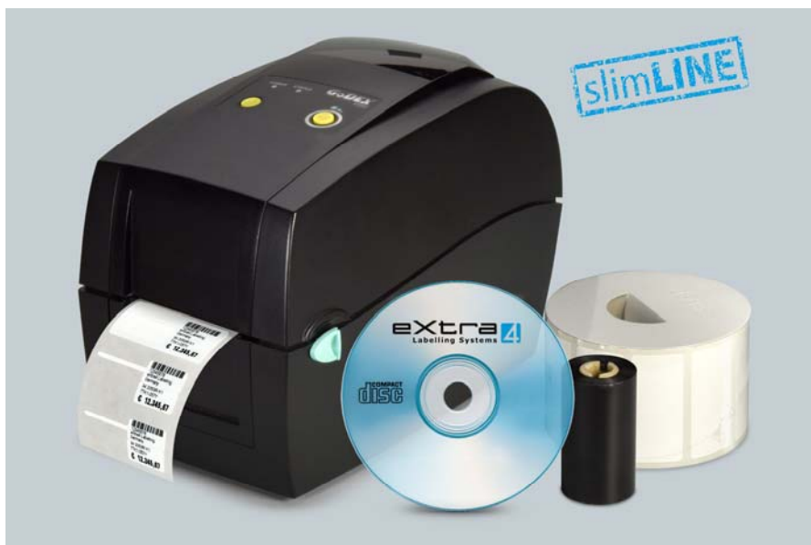
Abb. 6: „slimLINE“-Einstiegerpaket mit Etikettendrucker Godex RT200, Etikettendruck-Software eXtra4, Schmucketiketten und Farbband