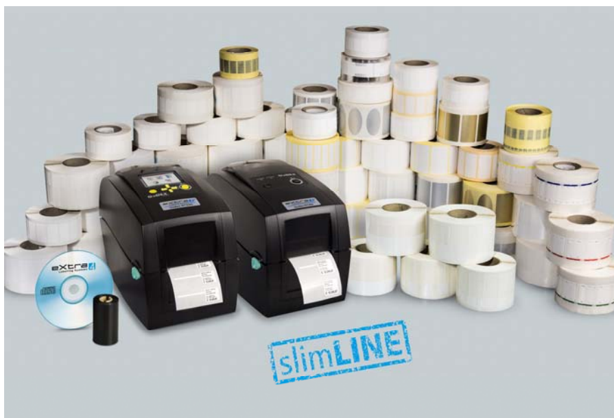
Abb. 2: „slimLINE“-Produktreihe mit Etikettendrucker Godex RT-Serie, Etikettendruck-Software extra4, Schmucketiketten und Farbband