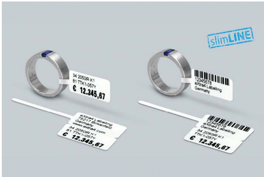
Abb.3: Druckbild des „slimLINE“-Druckers Godex RT200 mit 200 dpi auf „slimLINE“-Schmucketiketten mit Schlaufe, Typ 34 2050IR K1