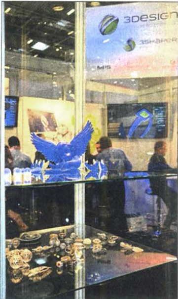
MIT 3-D-DRUCK machte die Firma MPS auf sich aufmerksam bei der Inhorgenta.

Nach Samstag bis Dienstag in diesem Jahr, soll die Inhorgenta 2018 wieder im gewohnten Fenster Freitag bis Montag sein: Der Termin dafür ist vom 16. bis 19. Februar.